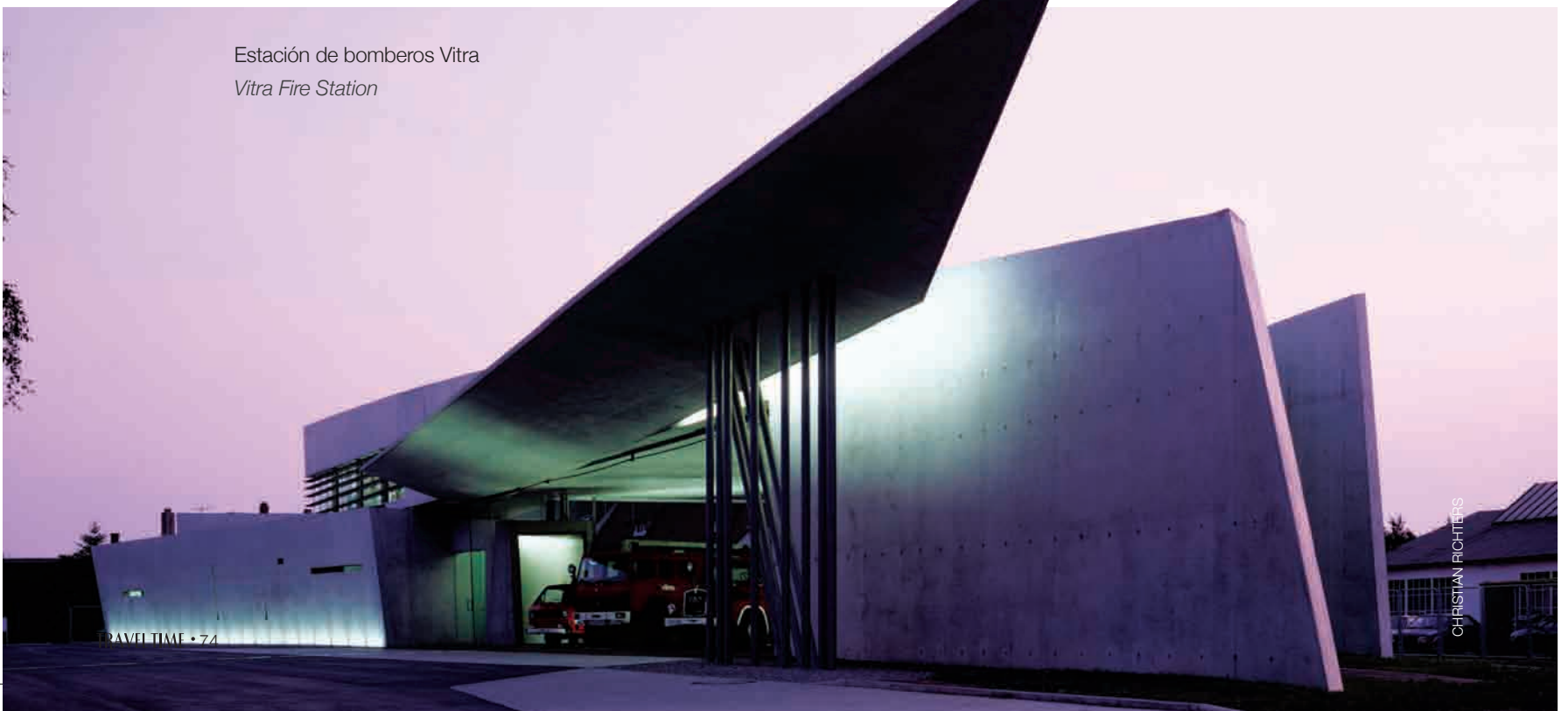
Estación de bomberos Vitra Vitra Fire Station

The Phaeno Science Centre in Wolfsburg, Germany combines a formal and geometric complexity with structural audacity and material authenticity.