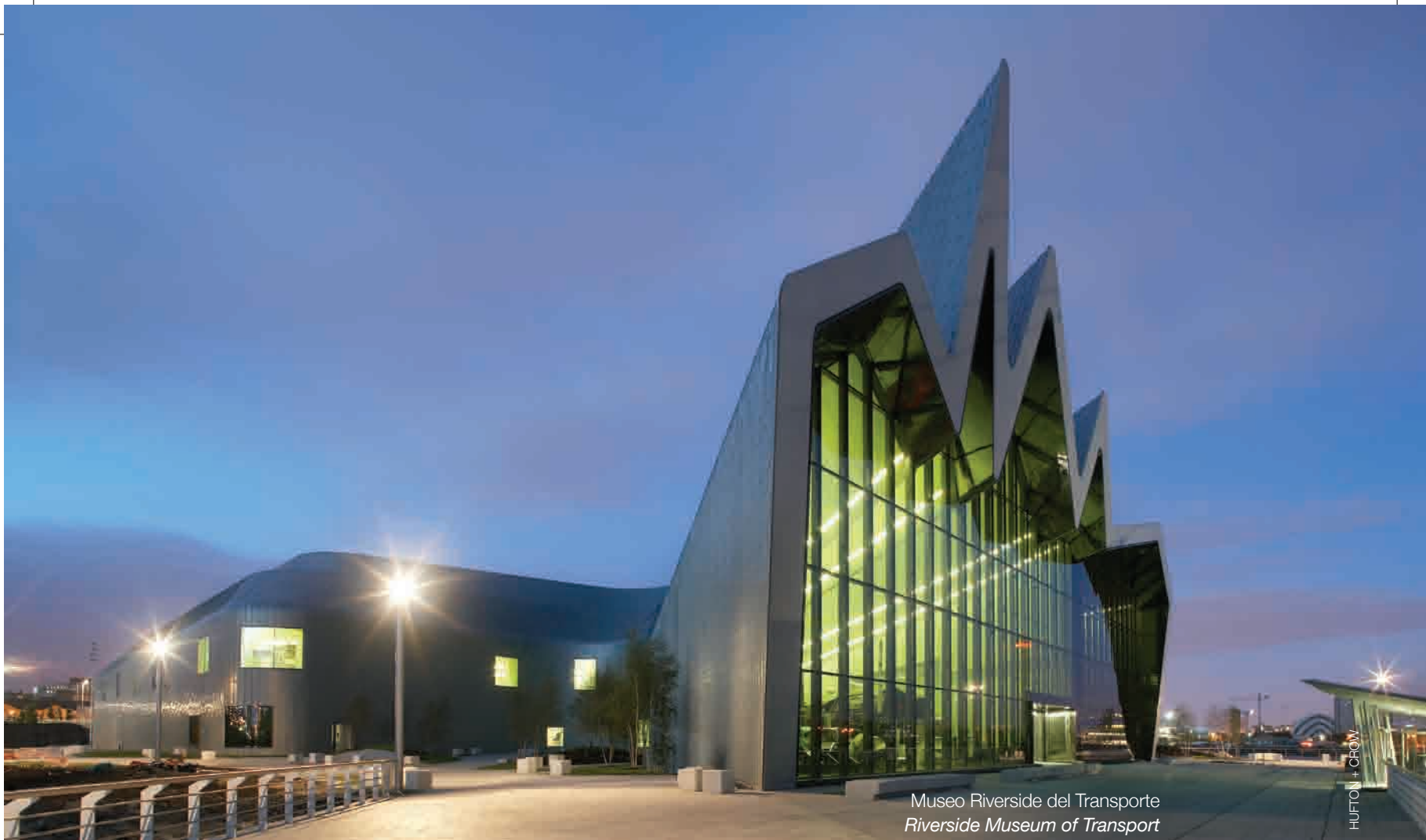
Museo Riverside del Transporte Riverside Museum of Transport